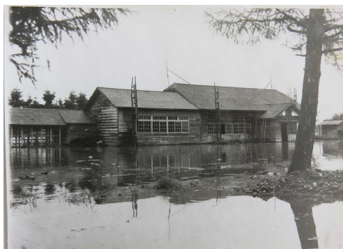
昭和28年8月1日 智西小学校

8月末の全校朝会で智恵文地区の水害の歴史(昭和28年に智西地区)の写真を見せました。また、学校の玄関前に指定緊急避難場所の看板が設置されました。それに最大3mの水が押し寄せる可能性があるとして示されています。災害や事故への備えを大切にいたします。