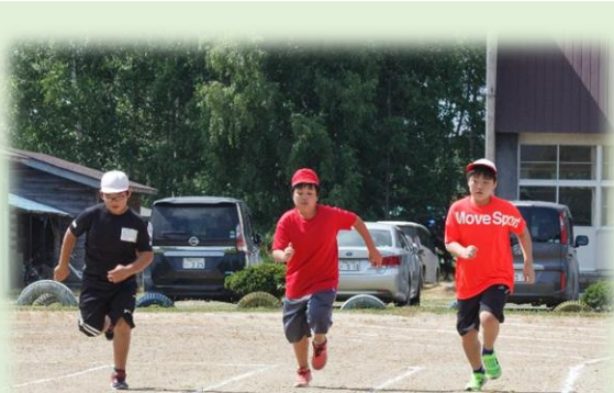
『智小オリンピック』(6年生)

新型コロナウイルス感染拡大防止の観点から延期となっていました『智恵文保・小・中合同運動会・体育祭』を7月17日(土)に開催することができました。当日は30℃を越える気温が予報される中でしたが、子どもたちは最後まで元気に、そして一生懸命に、それぞれの競技に取り組むことができました。2年振りに開催された運動会は、感染症対策や熱中症の予防、時間短縮、競技の削減や参観者の制限等、今できることの中で試行錯誤しながらの実施でした。熱い中、例年と変わらず応援していただいた保護者の皆様、前日準備や後片付けのお手伝いをしていただいた保護者の皆様に感謝いたします。ご協力、ありがとうございました。