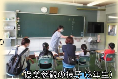
授業参観の様子(3年生)

7月2日(金)に参観日を行いました。当日はお忙しい中、ご参観いただき、ありがとうございました。4月以来、今年度2回目の参観日でしたが、子どもたちの学習の様子はいかがでしたでしょうか。また、授業後の各学級での懇談では、学校・学級での取組や子どもたちの成長や課題について、お話しさせていただきました。ご家庭での様子についても交流することができ、学校にとっても有意義な参観日となりました。ありがとうございました。