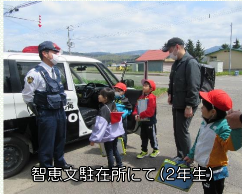
智恵文駐在所にて(2年生)

学校の中だけではなく、地域にも先生がたくさんいます。今後も畑の先生、町の先生として、ご指導よろしくお願ひします。