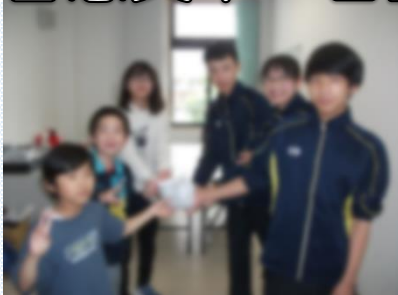
生徒会室(新校舎)で活動交流

6月19日(月)、智恵文中学校一日登校が行われました。1回目の今回は、中学校で学習をしますが、授業は普段通り、担任が行います。子どもたちも少しの緊張感と大きな期待感をもって、一日を過ごせたと思います。放課後には智恵文小児童会の役員と智恵文中生徒会の皆さんが活動を交流し合う時間もあり、有意義な一日となりました。