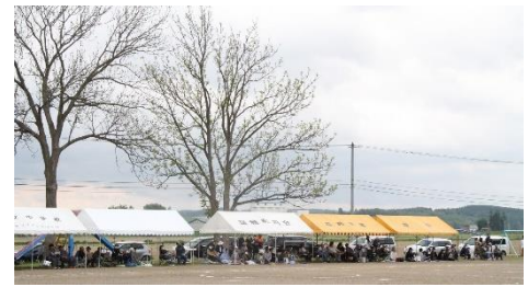
▲たくさんの町内会のテントが立ちました

4月にスタートした令和5年度も4分の1が過ぎ、約3週間後には夏休みが始まります。この間、運動会など様々な行事が行われました。今年は小学校のグラウンドで行う最後、そして、PTAに協力いただき、地域のテントが久しぶりに設置された保小中合同運動会・体育祭でした。保護者の皆様だけでなく、卒業した高校生なども参加して地域種目を行うこともでき、新たな形の運動会を探ることができたと感じています。次年度は、現中学校に開校する義務教育学校の新しいグラウンドでの開催となります。どんな形になるかご期待ください。