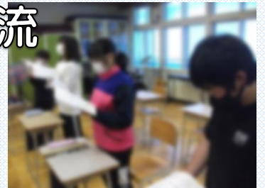
音楽室(旧校舎)で音楽の授業

6月19日(月)、智恵文中学校一日登校が行われました。1回目の今回は、中学校で学習をしますが、授業は普段通り、担任が行います。子どもたちも少しの緊張感と大きな期待感をもって、一日を過ごせたと思います。放課後には智恵文小児童会の役員と智恵文中生徒会の皆さんが活動を交流し合う時間もあり、有意義な一日となりました。