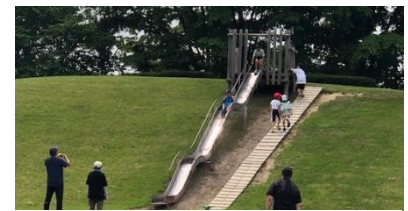
▲遠足も日進でのクマ出没にともない浅江島公園へ変更しました。

さて、今年は風が強い年なのか、運動会の最終盤に急に強風が吹き出し、テントの桁や梁を観客の皆さんに押さえていただく場面もありました。テント固定はしましたが、危険も感じられましたので児童生徒テントを畳む対応をとりました。振り返ると、この四半期は安心・安全について省察させられる場面が多かったと感じます。