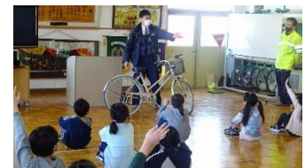
▲智恵文交通安全協会の支援での交通安全教室です。これも強風で屋内実施でした。

「気づき、考え、行動する」力を子どもたちに育むためにも、善し悪しの判断など適切なご指導をいただければとお願いいたします。