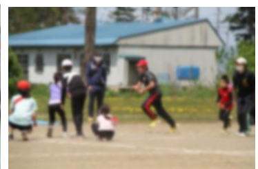
▲5月 合同運動会(リレー)

5月。 本校グラウンドを会場に久しぶりに地域種目を復活した保小中合同運動会・体育大会を行いました。日頃、勝敗を競う機会が少ない中、紅白に分かれ、高学年がリーダーとなって練習から全学年がつながり、競技に取り組みました。下級生に対する優しさや全力で競技に立ち向かう真剣さが伝わり、成長を感じました。