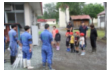
▲7月 産業高で連携事業

6月。 運動会で高めた「つながる力」「相手を大切にできる力」を生かし、中名寄小との宿泊研修や集合学習を実施。自分のよさや友だちのよさを見つめ、認め合い、一緒に高まり合う活動。こうした活動が「安心感」を生み、一人一人の挑戦や成長を支えました。