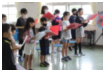
▲4月 全校合唱の再開

4月。 入学式のない中、全校児童13名でのスタート。今年は、音楽発表会や学芸会だけでなく校舎お別れの式典なども意識して歌の取組を再開しました。朝の会から、仲間と一緒に元気よい歌声が校内に響いています。得手不得手はありますが、心をそろえて「今できること」に一生懸命に取り組んでいます。