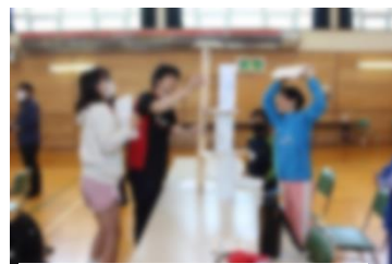
▲6月 中名寄小で集合学習

5月。 本校グラウンドを会場に久しぶりに地域種目を復活した保小中合同運動会・体育大会を行いました。日頃、勝敗を競う機会が少ない中、紅白に分かれ、高学年がリーダーとなって練習から全学年がつながり、競技に取り組みました。下級生に対する優しさや全力で競技に立ち向かう真剣さが伝わり、成長を感じました。