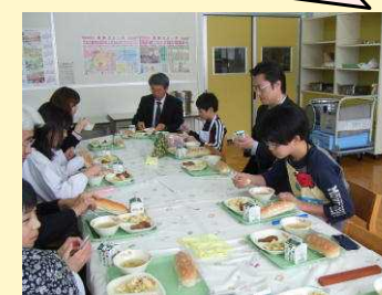
会議の後はみんなで給食

みんなの質問一つ一つ丁寧に答えていただきました。子どもたちは、物事がいろいろなことと関わり合いにつながっていることを学習することができました。