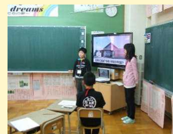
電子黒板で学校紹介