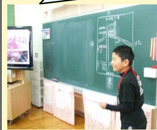
地図を使って質問します