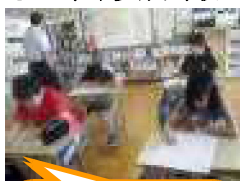
7月27日(金)夏休み講習会。プリントを使って国語や算数の復習をしました。

2学期には、下多寄神社祭(獅子舞と浦安)、名寄市小中学生音楽発表会、学芸会などがあり、子どもたちの表現力が試される機会が多く巡ってきます。地域の子どもとして、そして、下多寄小学校の児童として、精一杯に活躍してもらえることを期待しています。