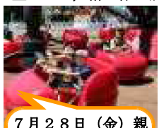
7月28日(金)親子社会見学。北海道グリーンランド(岩見沢市)で楽しみました。