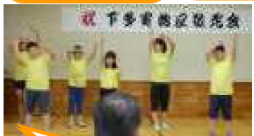
8月10日(金)敬老会。ダンス前前世を披露しました。