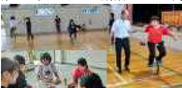
8月19日(日)一輪車教室&ボードゲーム会。