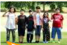
8月20日(月)2学期始業式。全員元気に登校。