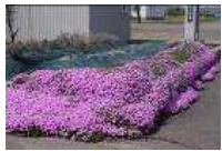
「すももの木」と「芝桜」