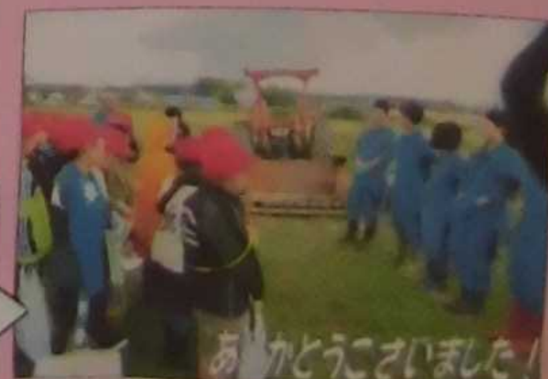
あ、かとうございました!

収穫直後より1か月くらい置くと デンプンが糖(砂糖の仲間)になり、 収穫直後より美味しくなるのだ!