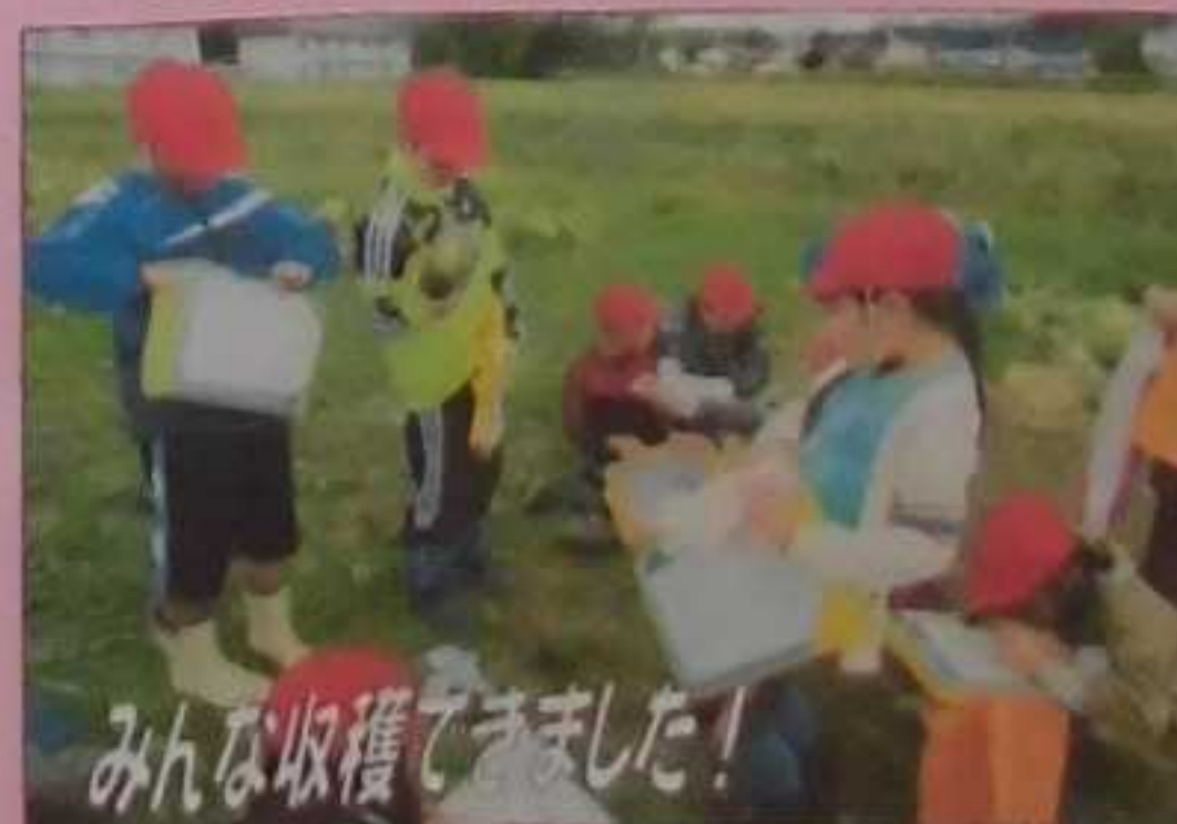
みんな収穫できました!