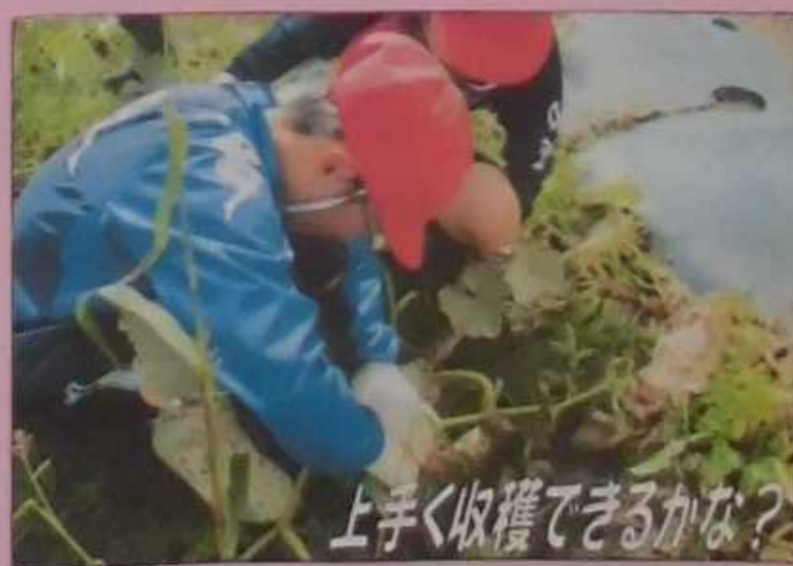
上手く収穫できるかな?