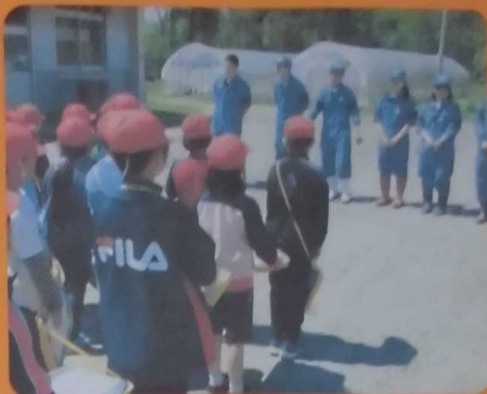
マリーゴールドとひまわりの種を観察