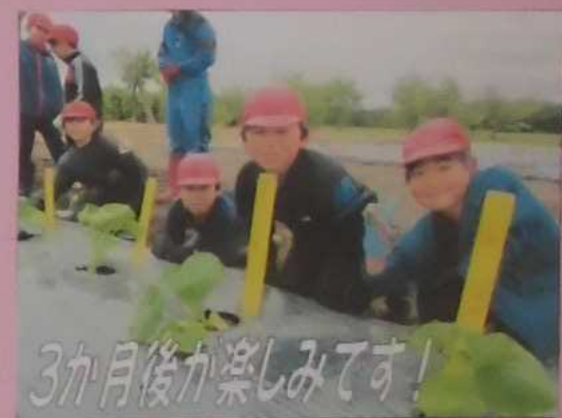
3か月後が楽しみです!