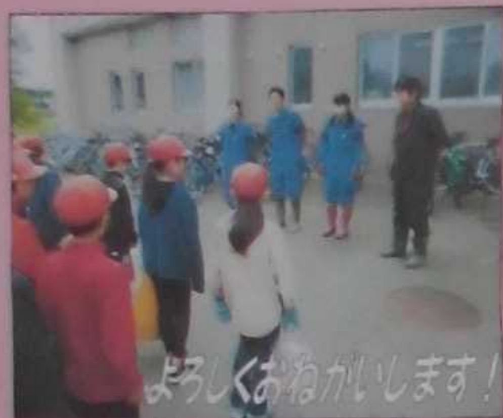
よろしくおねがいします!