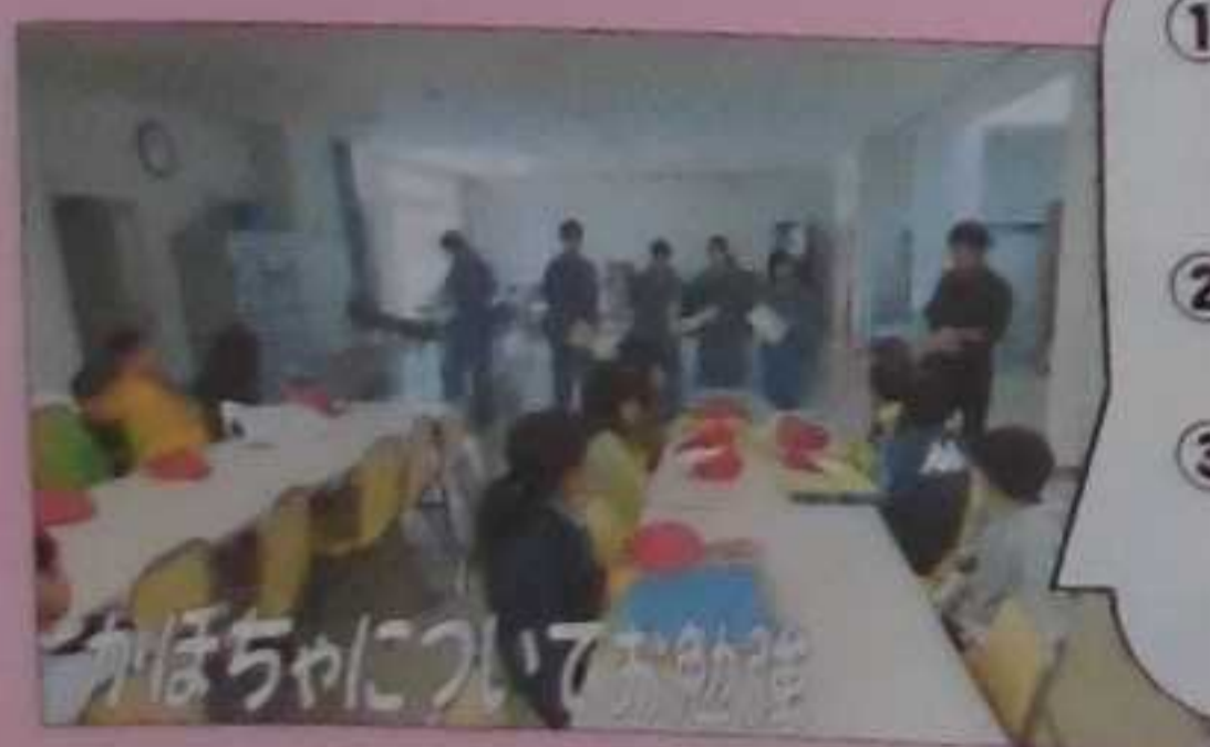
かぼちゃについてお勉強