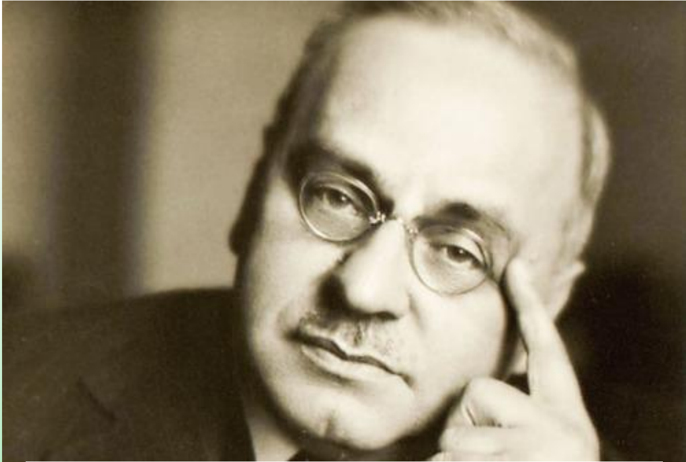
アルフレッド・アドラー