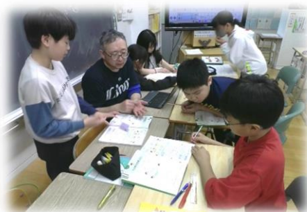
学級担任にアドバイスをもらいながら解き方を考えている子どもたち