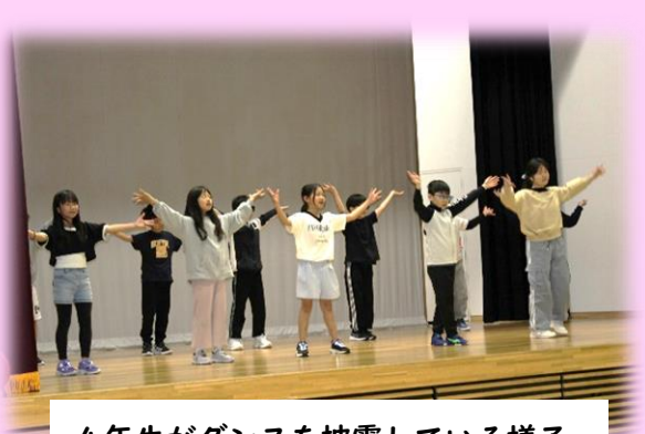
4年生がダンスを披露している様子

5月18日(月)に第1回が行われ、4年生が発表しました。内容は、体育のリズムダンスで学習した「カリスマックス」です。4年生は、学習の成果として「カリスマックス」の踊りを元気いっぱい披露してくれました。会場は手拍子で包まれ、子どもたち、教職員が心をつなげて、4年生の頑張りを応援しました。