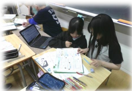
教科書の図を使い、仲間と相談しながら解き方を考えている子どもたち