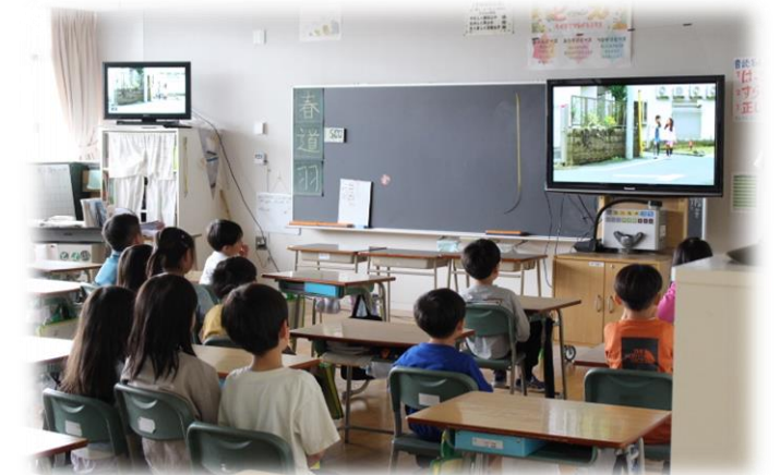
子どもたちは、動画で真剣に不審者対応について学びました