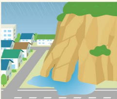
● 湧水量の増加 ● 表面流発生