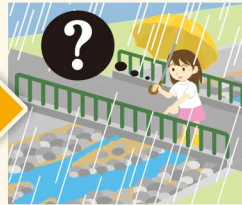
● 降雨時での水位の激減 ● 地鳴り・ゴーという音 ● 土臭いにおい