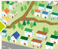
● 亀裂・段差の発生・拡大 ● 斜面・構造物のせり出し ● 樹木の傾き、根の切れる音