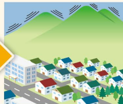
● 山鳴り・地鳴り ● 地面の振動