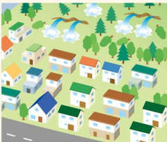
● 湧水量の増加 ● 湧水の枯渇 ● 井戸水のにごり