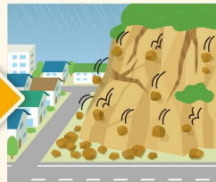
● 小石がぼろぼろ落下 ● 亀裂発生、斜面のせり出し ● 湧水の停止・噴き出し