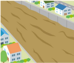
● 流水の異常な濁り