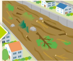
● 流木が発生 ● 溪流内の転石の音