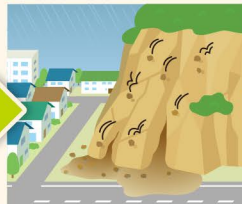
● 小石がばらばら落下 ● 湧水の濁り ● 新たな湧水発生