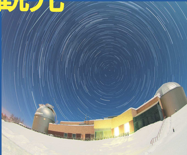
なよろ市立天文台きたすばる

名寄市は国内でもトップクラスの星空のまちです。天文台では「50cm反射望遠鏡」や国内最大級の口径を誇る北海道大学所有の「1.6m反射望遠鏡(愛称:ピリカ望遠鏡)」を利用したの観望を行っています。