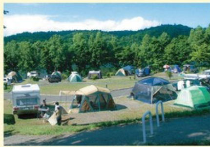
△△ ふうれん望湖台自然公園