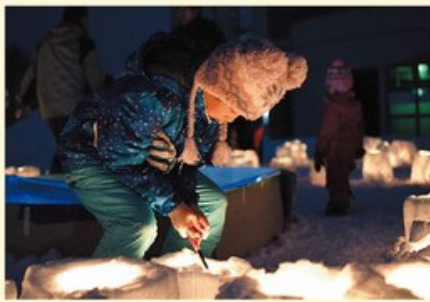
△△ 福祉センタースノーランタン