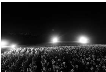
▲夜のひまわりは昼とはまた違う雰囲気。