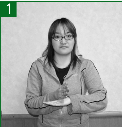
手の甲に他方の手を乗せます。