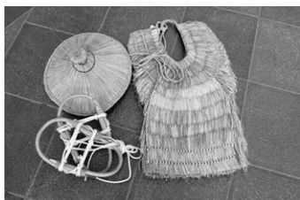
▲東北由来の民具(蓑、笠、かんじき)