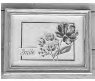
▲フォトフレーム作品例

「パーパークラフト教室」 ◇とき 2月6日(土) 10時～11時30分 ◇内容 市民文化センター市民工芸室