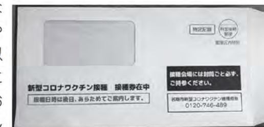
▲接種券は水色の封筒に封入してお届け

なお、3回目接種に必要な接種券については、予診票やハイヤー料金助成券（65歳以上）を同封した 水色の封筒 にて、2回目接種を終えたおおよそ7カ月後までにお届けします。