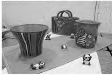
▲昨年の展示発表の陶芸作品

第65回市民文化祭 11月5日(土)・6日(日) 市民文化センター ※東館で展示発表、西館で芸能発表がおこなわれます。