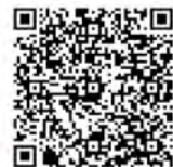
▲インターネットでの申し込みはこちらから

「はじめの一步!」 けんぱんハーモニカ を開催します 11月26日(土)、27日(日) 10時~11時(全2回) 市民文化センター生活研修室