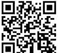
▲ツイッターはこちらからアクセスできます

Sスキマロキの現地解説と冬囲いについて 冬の道北で活躍したSスキマロキ「キマロキ」は、状態維持のため積雪前の10月中旬に冬囲いを行います。 また、日曜・祝日の13時~15時にはキマロキ保存会会員の方が現地でもキマロキの解説を行っています。