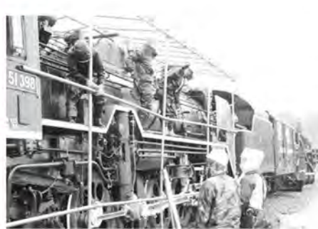
▲昨年の冬囲いのようす

北国博物館利用案内 観覧料 一般・学生220円、65歳以上110円、団体(10人以上)152円、高校生以下無料 企画展(無料) 市指定文化財 名寄教会会堂 日本基督教団名寄教会の会