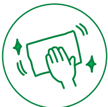
記載台・鉛筆の 消毒