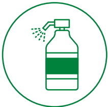
アルコール 消毒液の設置