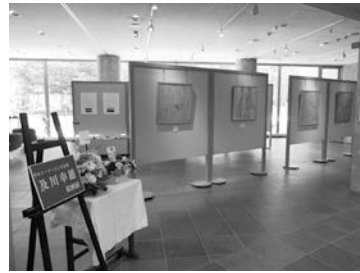
▲昨年の絵画展のようす