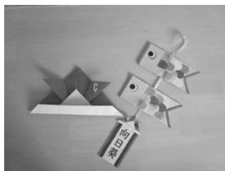
▲こいのぼりの製作例