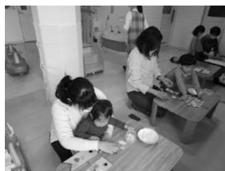
▲ベビー・キッズクラフトのようす