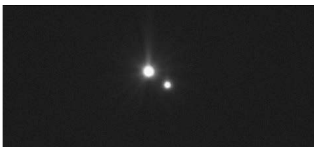
2023年3月4日撮影

肉眼では1個の星にしか見えないのに、望遠鏡で観察すると2個の星に見える天体があります。このような天体を二重星と呼びます。「コル・カロリ」はりょうけん座で輝く二重星で、2個の星がお互いの重力で結びついている連星系をなしています。4月11日(火)からの二重星観望会では、さまざまな二重星を楽しめます。