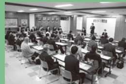
◀ 昨年のまち懇のようす

問い合わせ 町内会連合会事務局 (名寄庁舎3階総合政策部地域課題担当) ☎01654②2111 (内線3311)