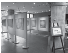
▲昨年の絵画展の様子