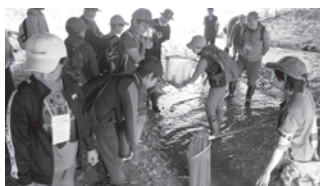
▲昨年度の自然観察クラブの様子