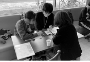
▲スマホなんでも相談室の様子