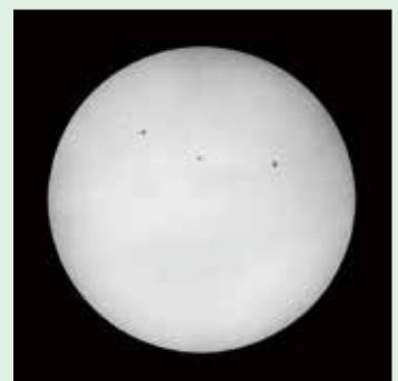
「太陽」 (2026年3月5日撮影)

そのようにまだ話題の多い太陽を、5月27日から6月7日開催の「太陽観望会」にて専用の望遠鏡で観察してみませんか？