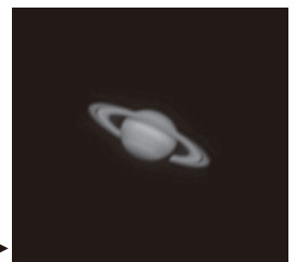
2012年3月11日撮影▶