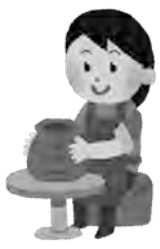
市民講座「陶芸教室」

放送大学10月学生募集 放送大学はテレビなどの放送やインターネットを利用して授業を行う通信制の大学です。さまざまな目的で幅広い世代、職業の方が学んでいます。 ●学習分野 心理学・福祉・経済・歴史・文学・自然科学など ●出願期限 8月31日(日) ●資料請求先 放送大学北海道学習センター旭川サテライトスペース(☎01666-2212627)