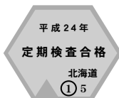
定期検査済証印(北海道の例)