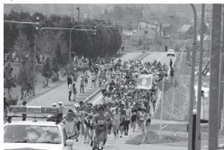
憲法記念ロードレース

北海道のみなさんを講師に行われ、楽しく走るコツやけがのしづらいランニングフォームなどの基礎知識を学びました。