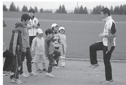
初心者ランニングセミナー