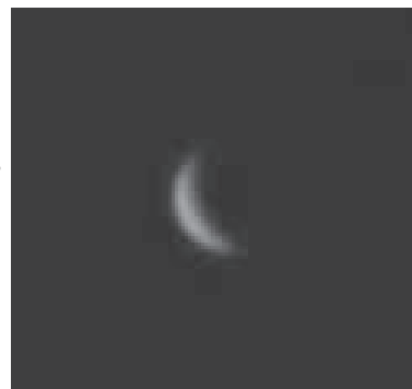
2010年12月2日撮影 ▶ 撮影者：大石尊久

金星探査機あかつきは、昨年12月7日に金星周回軌道に入る予定でした。減速に失敗し、金星を通過してしまいましたが、JAXA（宇宙航空研究開発機構）は6年後に再度金星周回に挑むことになっています。写真はあかつきが金星に到着する前に名寄から撮影した金星です。