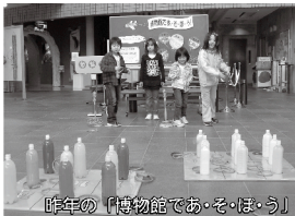
「昨年の「博物館であ・そ・ぼ・う!!」」

手作りの木のおもちゃ、空き缶やペットボトル、牛乳パックなどを使ったリサイクルおもちゃで遊んだり、木工クラフトを体験できます。