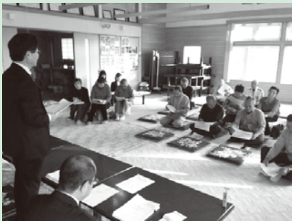
高見区福祉会館での意見懇談会の様子

「乗り継ぎ」をはじめ、各団体からの要望など様々な課題に対し、名寄市地域公共交通活性化協議会において検証され、課題の改善を図るため、新たに乗り継ぎなしの「東西まわり」を設けることが決定しました。