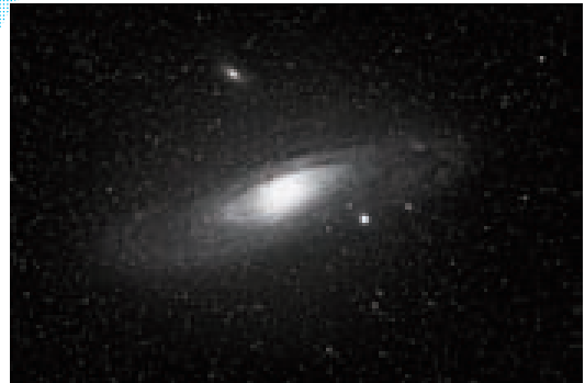
▲8月19日撮影