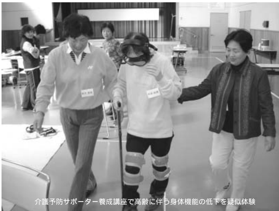
介護予防サポーター養成講座で高齢に伴う身体機能の低下を疑似体験