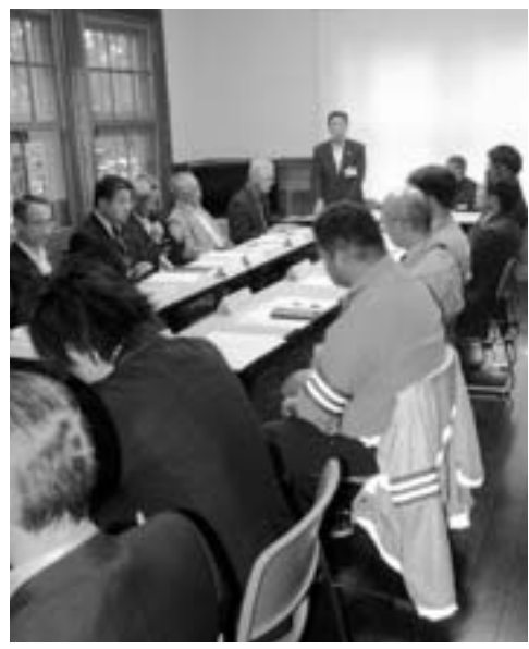
新たな交通システムが話し合われている 地域公共交通活性化協議会

広大な面積をもつこの地域では、自動車移動手段の主流になっていきます。自動車がない生活がとも不便になってしまふ現実があるものの、最近では高齢ドライバーの事故増加が社会問題になっていきます。