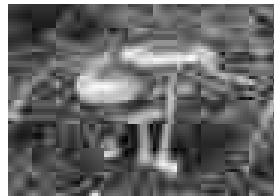
キノコ写真展より「タマゴタケ」