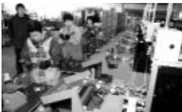
◀アスパラガス自動選別施設