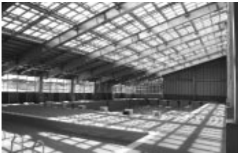
整備された南水泳プールの内部

企業会計とは 自ら事業を行い、その事業で得た財源で運営する、民間企業と同様の経理をする会計のことをいいます。