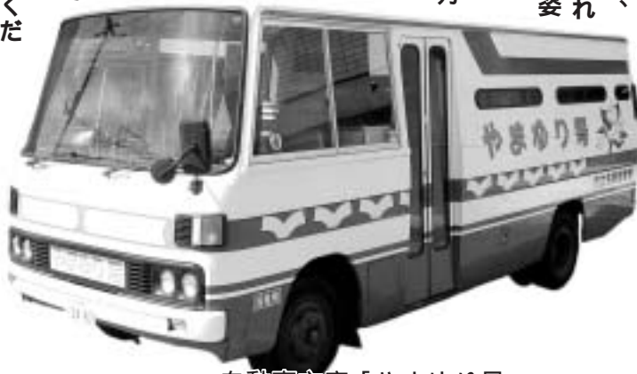
自動車文庫「やまゆり号」

本 の返却は、開館時間外でも返却ポストがありますので、ご利用ください。また、毎月、自動車文庫「やまゆり号」が市内を一巡しています。巡回日程は「広報なよろ」まなびの部屋・図書館に掲載していますので、図書館に足を運ばない方などは、そちらをご覧ください。