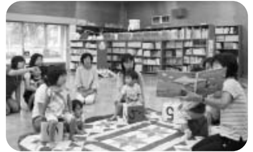
カンガルーのポケット