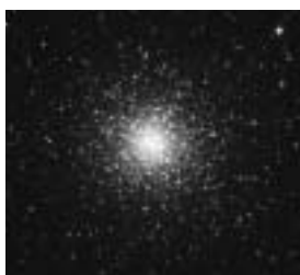
2006年4月27日 木原天文台40cm望遠鏡で撮影