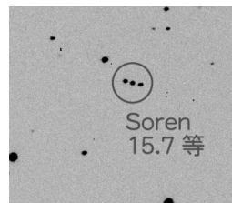
▲ 2011年10月27日撮影

右の写真は撮影時間の異なる3枚の写真を重ね合わせたものです。小惑星「Soren」が徐々に移動していくのがわかります。