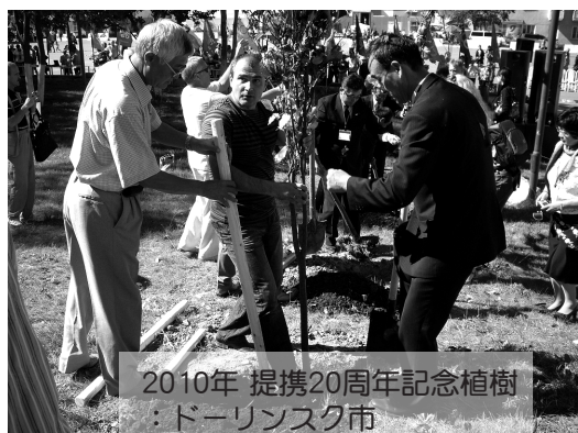
2010年 提携20周年記念植樹 ：ドーリンスク市