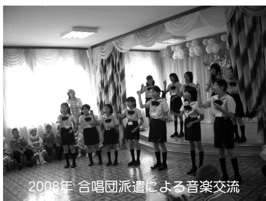
2008年 合唱団派遣による音楽交流