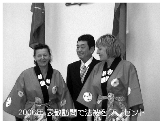
2006年 表敬訪問で法被をプレゼント

これを一つの節目として、さらに相互理解と親交を深め、若い世代へ交流が継承されることを願います。