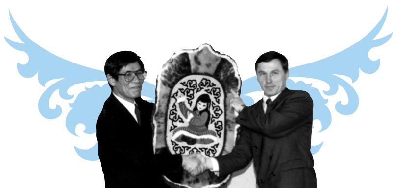
1991年3月25日友好都市の調印式 提携当時の桜庭市長とシドレンコ市長