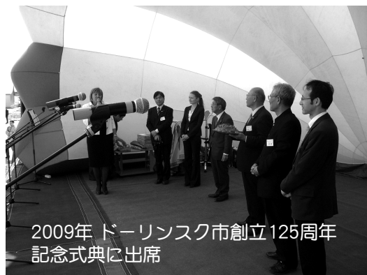
2009年 ドーリンスク市創立125周年 記念式典に出席