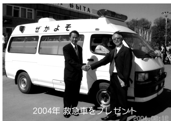
2004年 救急車をプレゼント

1988（平成63）年、第4回サハリン平和の船に名寄日ソ親善協会会長をはじめ3人の市民が参加したことがきっかけとなり、1990（平成2年）年10月、当時の桜庭市長、野村市議会議長らが公式訪問を行い、ロシア連邦サハリン州ドーリンスク市との交流がはじまりました。