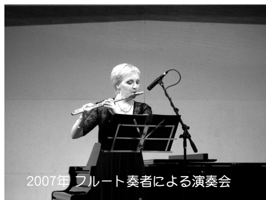
2007年 フルート奏者による演奏会