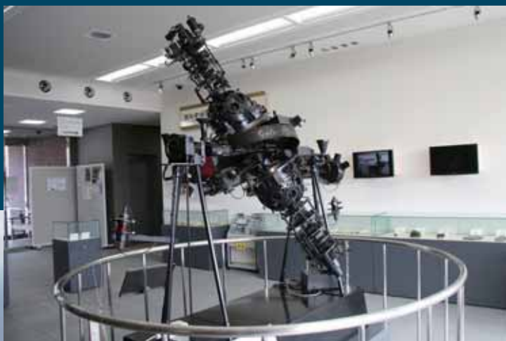
▲展示コーナーの旧プラネタリウム投影機