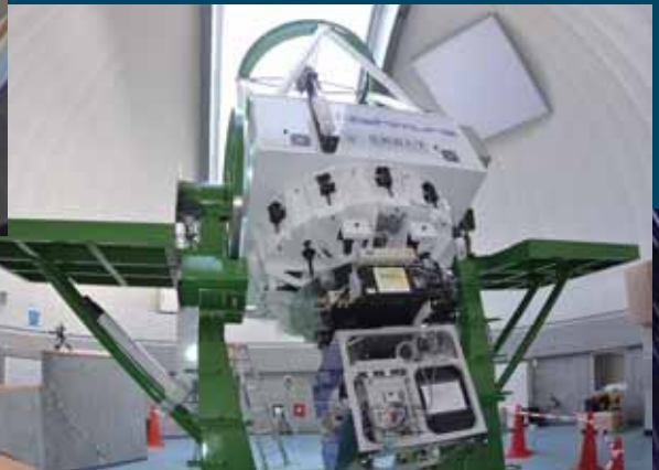
▲2010年12月、北海道大学により設置されたピリカ望遠鏡