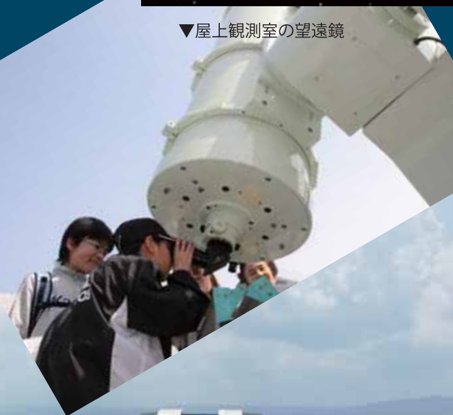
▼屋上観測室の望遠鏡