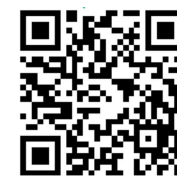
まめまき 申込用QRコード (小学生用)