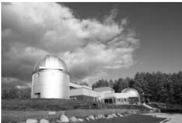
整備された市立天文台の外観 平成22年度の開館に向けた準備が始まります。