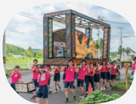
名高祭・行灯行列