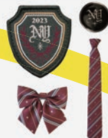
エンブレム／ボタン リボン／ネクタイ