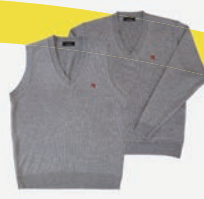
ニットベスト＆セーター