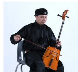
阿斯罕(アスハン)氏プロフィール

日時 9月28日(土) 13:30～15:00 会場 北国博物館ギャラリーホール・ラウンジ(観覧無料) 共催 名寄本読み聞かせ会、名寄市北国博物館 後援 北海道新聞社、名寄新聞社、北都新聞社、市立名寄図書館、名寄市教育委員会