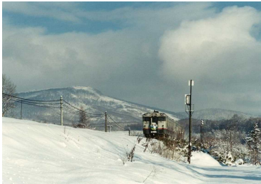
九度山のふもとをゆく急行宗谷