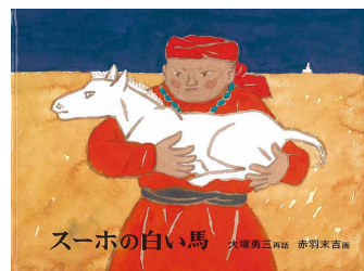
スーホの白い馬 大塚勇三(再話) 赤羽末吉(画) 福音館書店