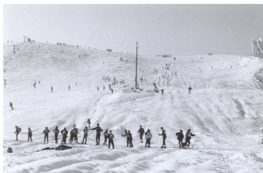
上：菊山スキー場 下：展示のようす

会期 開催中～2025年2月11日(火) 会場 北国博物館ギャラリーホール・ラウンジ(観覧無料)