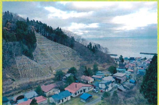
【令和3年度写真コンクール最優秀賞】 「集落を守る治山事業」 北海道函館市 山本竜太郎